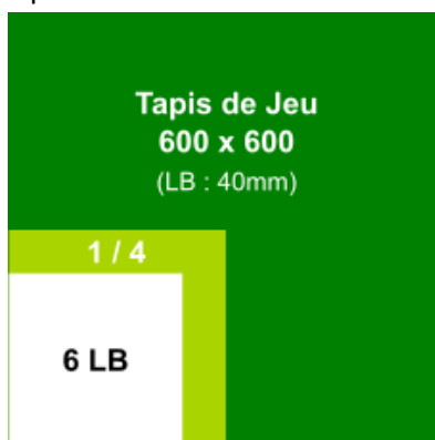
Zone de déploiement de la ZB en blanc dans son quart de table